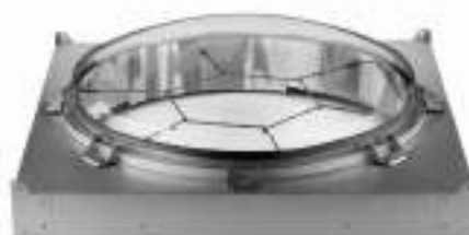
Domo SkyVault con red de seguridad