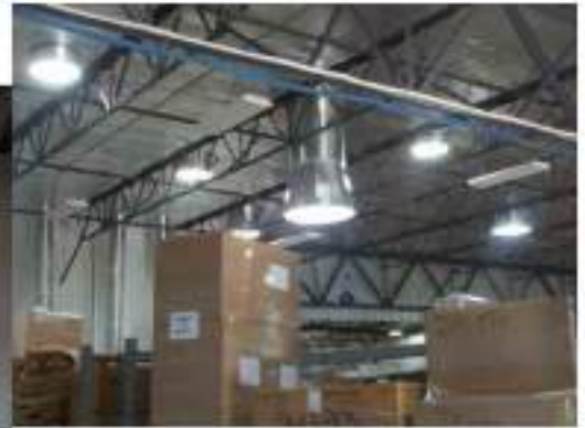
Solatube International Vista, CA