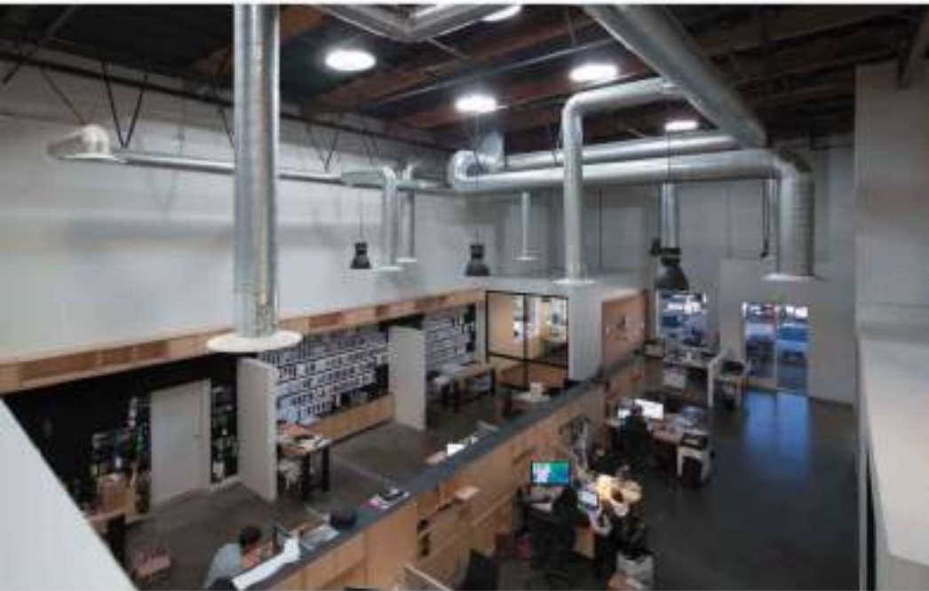
Stance San Clemente, CA