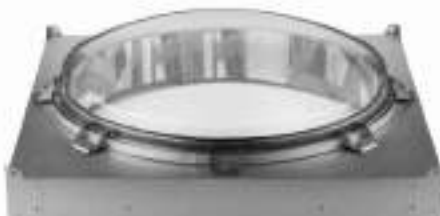
Doble Domo SkyVault