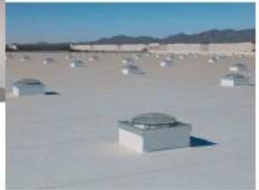
Macy's Fulfillment Center Goodyear, AZ