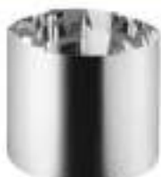
Tubos de extensión Spectralight Infinity