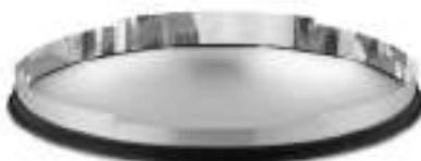
Difusor Para la serie SkyVault

El difusor circular prismático está diseñado para poder unirse fácilmente a tubos de extensión usando una conexión patentada Tab-Lock and Tube Belts.