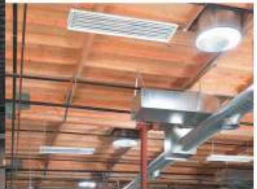
Trantronics Irvine, CA